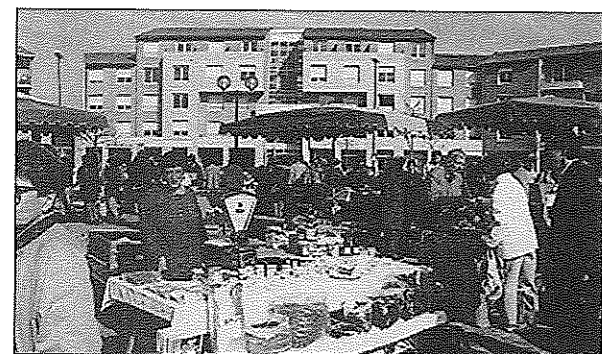
Le marché des Pradettes à ses débuts

n'est qu'un coup de promoteur réalisé au mépris des étudiants qu'on se propose de stocker, au mépris des