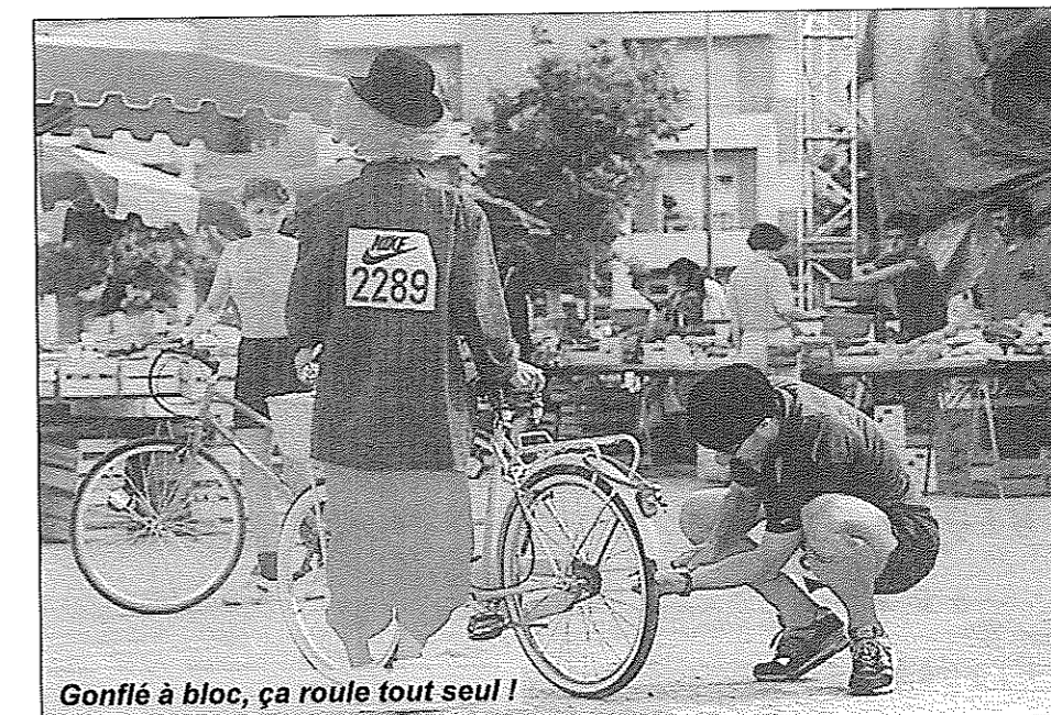
Gonflé à bloc, ça roule tout seul !

FÊTE d'ÉTÉ (Programme détaillé dans le prochain numéro de la Gazette)