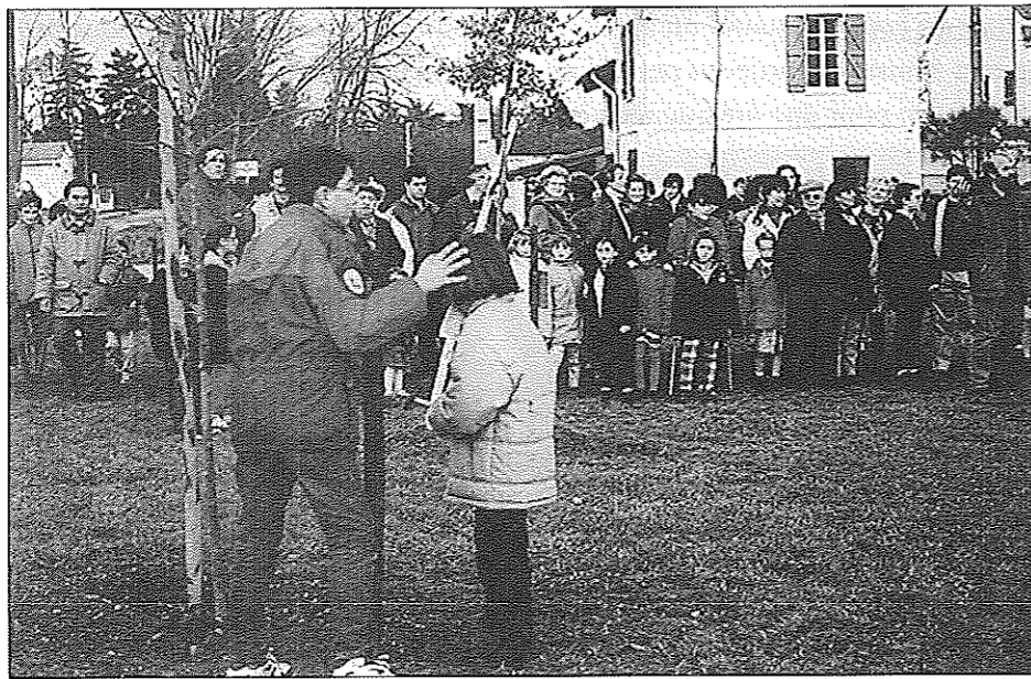
Janvier 95 : Le jardin des 5 continents prends racine

Les enfants inaugurent le «Jardin des 5 Continents» avec des dessins et des poèmes. C'est aussi le jour de l'inauguration par les habitants de la Maison de Quartier, jour de Magie aussi. L'inauguration officielle est l'occasion de redire tranquillement combien nous sommes heureux de franchir cette étape et combien nous serons heureux de fêter la fin de l'équipement du quartier. Mais nous ne sommes pas gens à bouder le plaisir : les jeunes ont un toit, le théâtre aussi. Tout arrive un jour si on s'en occupe ! Même un chapiteau pour «Pradettes Circus».