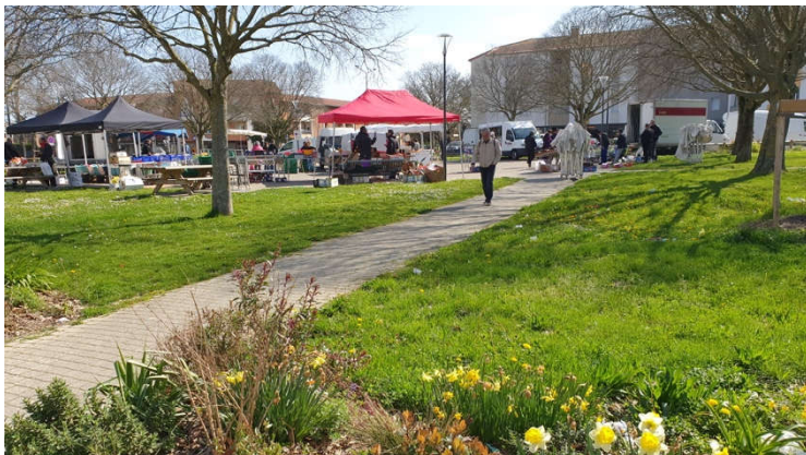
Le marché, le 21 mars 2020

Le marché du samedi est maintenu en vertu d'une dérogation préfectorale.